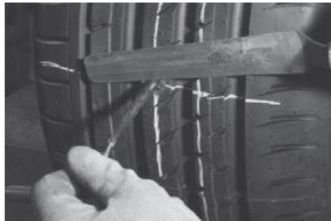
Mantar yama uzantısının kesilmesi

Lastiđi janta monte edin. Uygun lastik basıncını uyguladıktan sonra mantar yamanın dıřarıda kalan uzantısını bir bıak yardımıyla kesin.