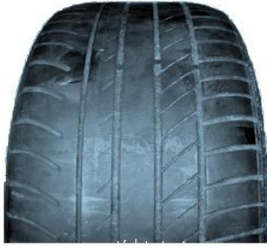
Minimum dış derinliği (yasal sınır 1,6mm)

Lastiklerin, aşınarak minimum dış derinliğinin altına düşmesi, hasar görmesi veya yıpranması (patlaklar, kesikler, darbeler, balon yapması vb.) gibi farklı nedenlere bağlı olarak değiştirilmeleri gerekebilir.