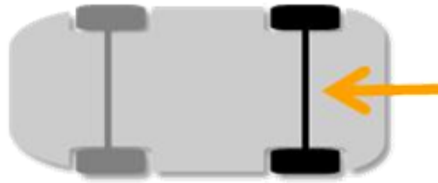
En yüksek dış derinliğine sahip lastikleri arka aksa takın.

Değişimi gereken lastikleri, yetkili satıcılarımız veya teknik personelimiz yardımıyla belirleyebilirsiniz. Lastik değişimi sırasında aynı aks üzerindeki lastiklerin aynı marka/ebat/desen/hız ve yük endeksine sahip olmasına dikkat edin. Her zaman araçta bulunan en yüksek dış derinliğine sahip 2 lastiği arka aksa takın.