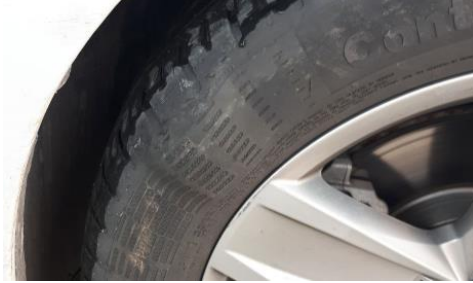
Darbe hasarı (yanakta balon)

Continental lastik değişimi için, yaz lastiklerinde 3mm ve kış lastiklerinde 4mm dış derinliklerini önermektedir.