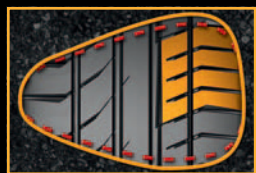
Tecnologia de Macro blocos