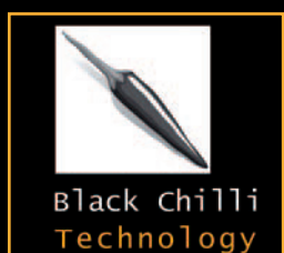
Black Chilli Technology

A tecnologia de macro blocos do ombro exterior do pneu permite uma maior área de contacto, o que cria uma adaptação otimizada à superfície da estrada. O ContiSportContact 5 oferece uma aderência à estrada aperfeiçoada e, portanto, mais segurança em curva.