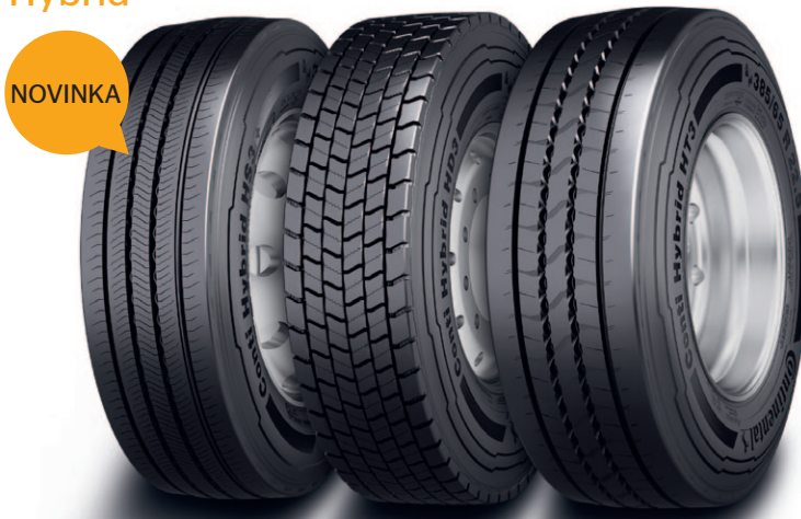
Conti Hybrid HS3+ Conti Hybrid HD3 Conti Hybrid HT3 3