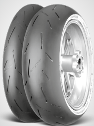
ContiRaceAttack 2 Street