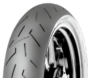
150/65 R 18