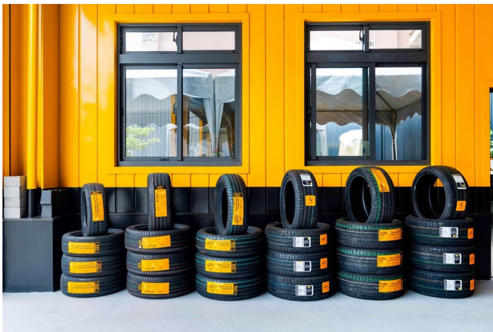
將具代表性的輪胎依序陳列，清楚展現品牌花紋特色，讓車主一目瞭然各型號差異。

收銀區特別設置玻璃窗口，讓車主在結帳與諮詢時有更直覺的互動方式；休息空間除了舒適的室內座位外，也延伸到店外的小片綠地，提供更放鬆的等候氛圍。老闆相信：「環境變好，心情就會跟著好；心情好，對保養的信任感也會提升。」久豐輪胎行正是以這樣的理念，打造出獨特又貼心的門市型態。