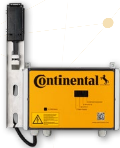
2 Lecteur de cour