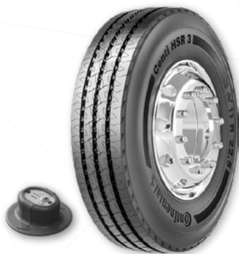
1 Capteur de pneu (un par roue utilisée)