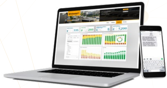
3 Portail Web et alertes mobiles